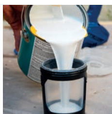
1. Wypełnij worek FlexLiner™ materiałem