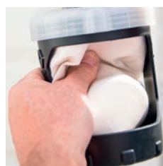
2. Wyciśnij pozostały materiał