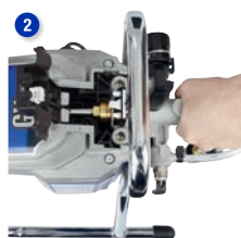
Wymij sekcję pompy