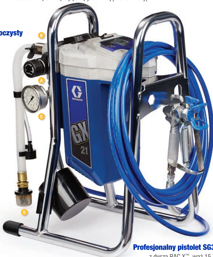
Profesjonalny pistolet SG3™ z dyszą RAC X™, wąż 15 m.