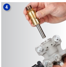
Zainstaluj nowy kartridż i wymień pompę