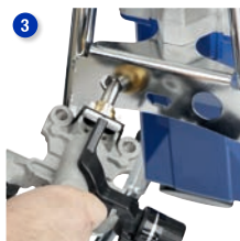
Używając sześciokątnego złącza na ramie, poluzuj pompę i wymij kartridż