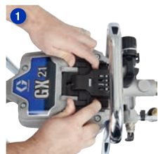
Przesuń i unieś drzwiczki dostępu